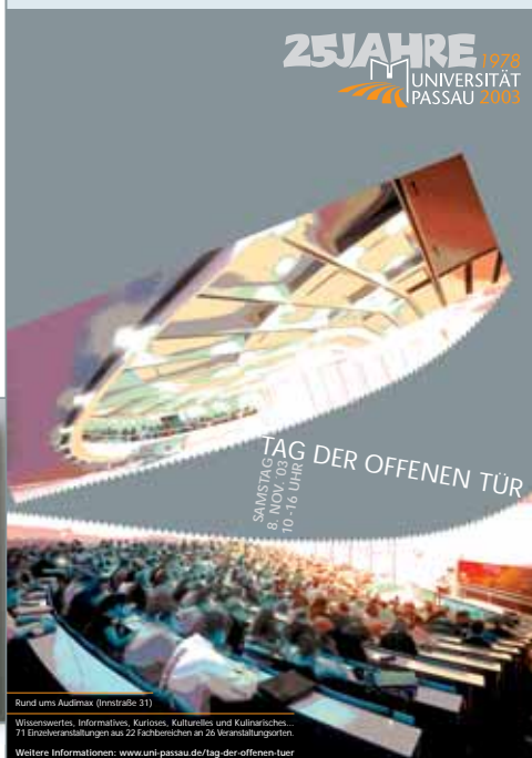
Rund ums Audimax (Innstraße 31) Wissenswertes, Informatives, Kurioses, Kulturelles und Kulinarisches... 71 Einzelveranstaltungen mit 22 Teilbereichen an 26 Veranstaltungsorten Weitere Informationen: www.uni-passau.de/tag-der-offenen-tuer