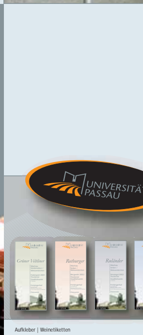
Aufkleber | Weinetiketten